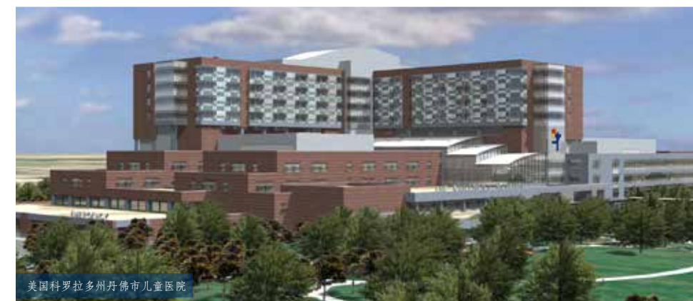
美国科罗拉多州丹佛市儿童医院