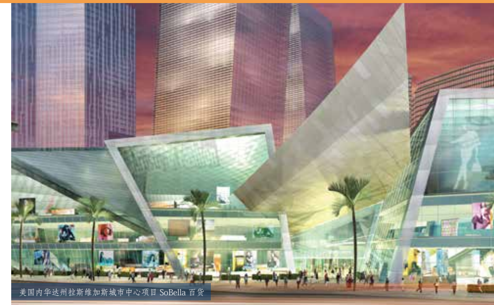
美国内华达州拉斯维加斯城市中心项目 SoBella 百货

我们对建筑的洞察力显示出我们精深的知识和丰富的经验。对于任何综合系统，利浦公司的顾问都不会照搬以往的模式，而是进行创新性的设计。我们始终站在建筑设计、组织和运行系统“后勤”支持领域创新的最前沿，并以创新的思路实施每个项目。